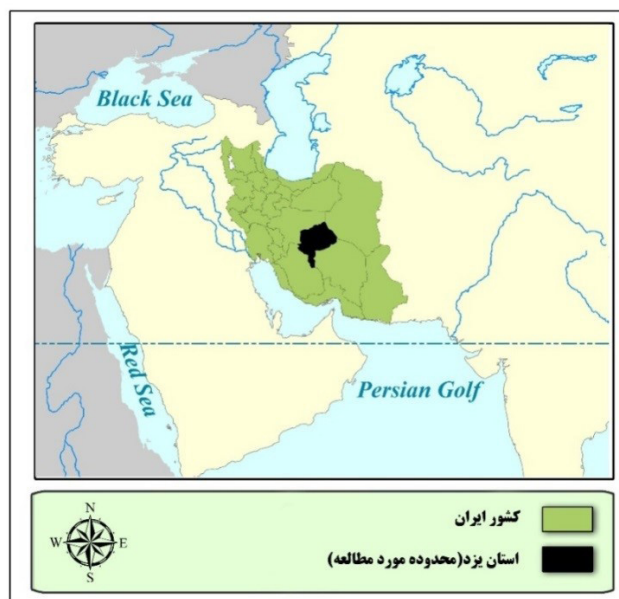
تصویر ۱. موقعیت فضایی استان یزد در ایران و منطقه خاورمیانه مطابق با تقسیمات جدید سال ۱۳۹۲.

استراتژی به ارزیابی نقاط مثبت (قوت‌ها و فرصت‌ها) و منفی (ضعف‌ها و تهدیدها) می‌پردازد. نهادها و سازمان‌هایی که این استراتژی را دنبال می‌کردند، به امید ایجاد تعادل، عوامل خارجی و داخلی را ارزیابی می‌کردند؛ اما یافتن نقاط ضعف و تهدیدها اغلب به جای سود باعث زیان می‌شد و به جای اجتناب از موانع و شکاف‌ها، به احساسی فزاینده از ناامیدی و ترس می‌انجامید. این تغییرات ناشی از تکرار تحلیل چیزی است که غلط و اشتباه بوده و همچنین آگاهی زیاد حول محور آنچه مطلوب نبوده است. این عامل سبب می‌شد برای پرداختن به بخشی از چشم‌اندازهای مطلوب آینده فرصت اندکی باقی بماند. دومین ویژگی مشخص استراتژی‌های توسعه سنتی، رویکرد برنامه‌ریزی بالا به پایین آن بود، یعنی گروه اندکی از افراد مافوق، مسئول ایجاد استراتژی و راهبرد بودند (Silbert and Silbert, 2007: 1).